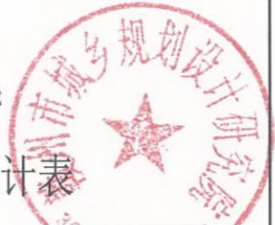
技术经济指标统计表