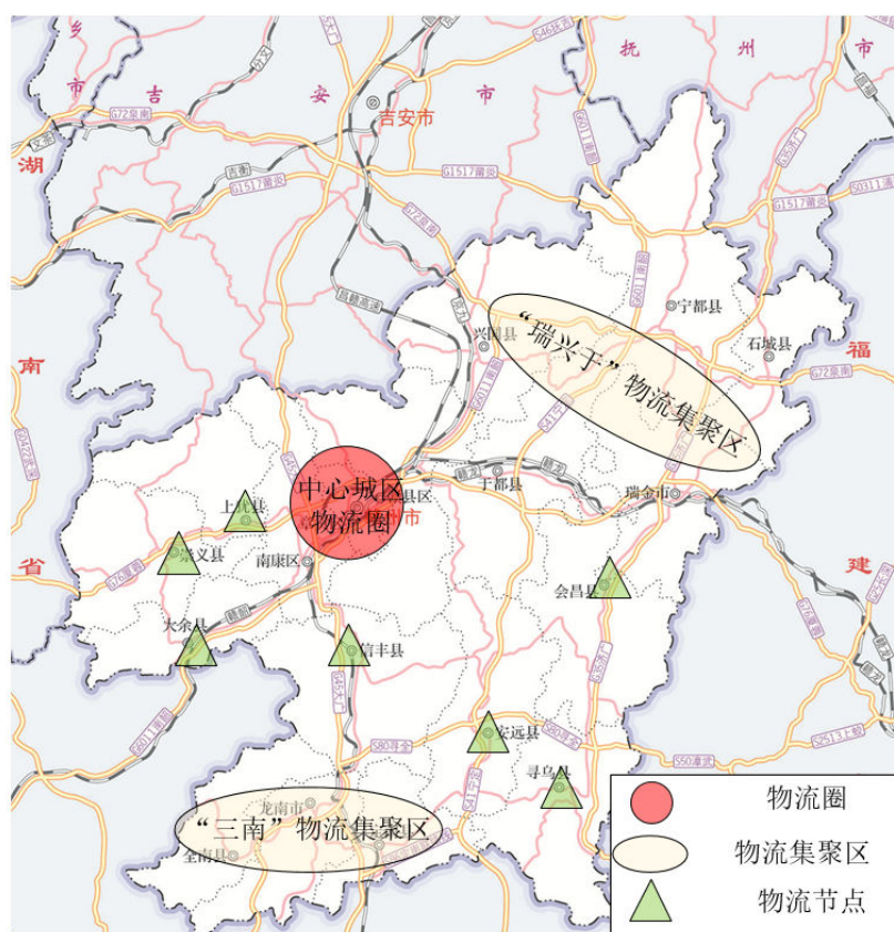
图 2 赣州市“十四五”物流网络布局图

会昌：建设瑞梅铁路综合物流园、九二氟盐化工基地综合物流园，整合优化快递、商贸、供销、交通等物流设施布局，完善县级物流中心，建设乡镇农村配送站、农村货运网点，构建城乡互动、县乡村互联、畅通高效的物流网络体系。