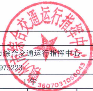
项目支出绩效目标表